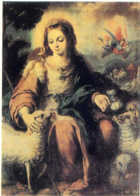
Divina Pastora de las Almas

Petición particular... Se reza el Avemaría.